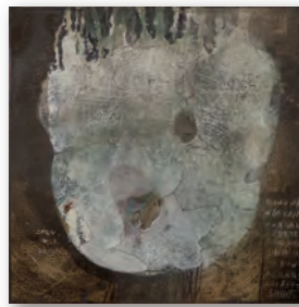
月の船 34.0 cm × 34.0 cm