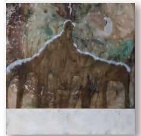
snow 110.0 cm × 112.5 cm