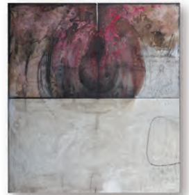
スタッキー・トフィー・プディング 166.0 cm × 146.5 cm