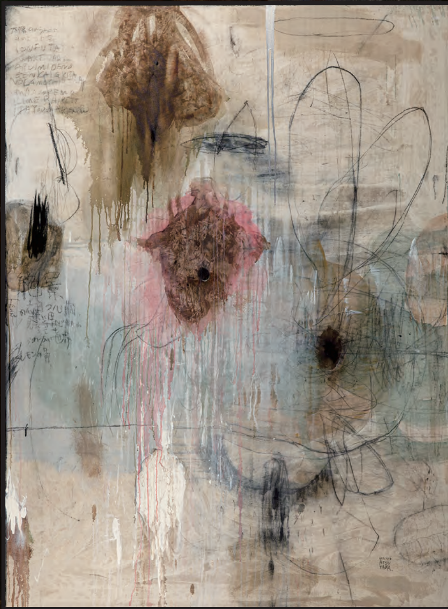
何から話せば。 220.0 cm × 160.0 cm