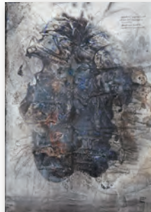
外骨格 51.5 cm × 36.4 cm