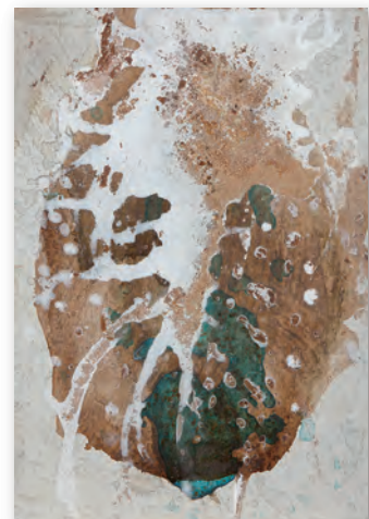
檸檬の骨 22.5 cm × 15.8 cm