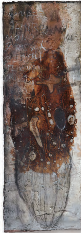
彗星 50.0 cm × 10.0 cm

It was about 280 million years ago that 'fully metamorphosed insects' appeared, which develop through a unique form of pupa. This evolution, which can be described as a dormant state, is said to be the reason why insects have been able to thrive on the earth for so long. In butterflies, the cells of the chrysalis dissolve once inside the chrysalis, and the adult parts are formed again. The 'result' of time building up and forming, and the 'mystery' that has yet to be solved. I am describing a world in which these two elements are intermingled.